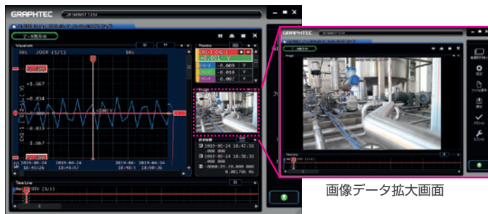
計測データと画像データが連携