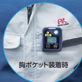
胸ポケット装着時