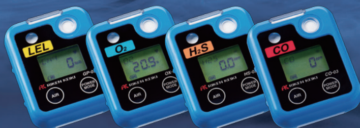
Model GP-03 可燃性ガス用