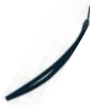
ハンドストラップ